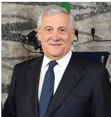
Antonio Tajani, Ministro degli Affari Esteri e della Cooperazione Internazionale

Antonio Tajani, Minister of Foreign Affairs and International Cooperation